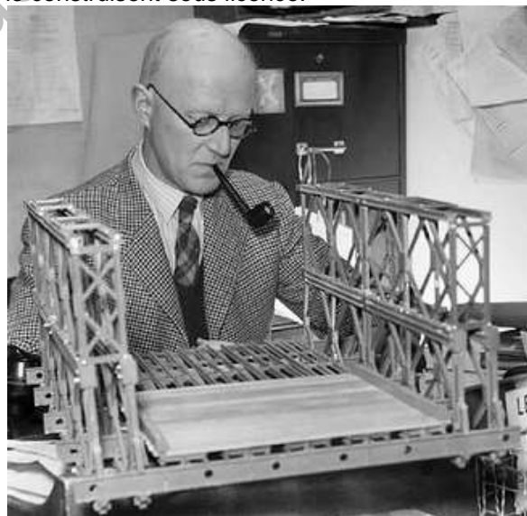
L'ingénieur Bailey (1901-1985) présentant un modèle réduit de son pont.

Après le conflit, des centaines de Bailey seront déployés en Europe pour la reconstruction des infrastructures détruites. Le pont est élargi pour permettre le franchissement des nouveaux chars lourds en service dans les armées de l'OTAN. Modernisé par la firme Mabey-Johnson dans les années 2000, il est encore utilisé de nos jours. En France, une réserve est notamment constituée par un organisme civil le Centre national des ponts de secours.