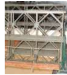
Tronçon de pont en configuration double-double (D-D).

L'assemblage des différents éléments forme un tronçon de 10 pieds (3,05 m). En multipliant et raccordant les tronçons on obtient un pont de la longueur nécessaire au franchissement de la brèche.