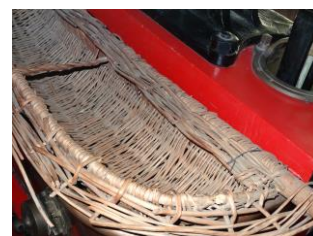
Tamis d'osier pour le filtrage de l'eau de cuve